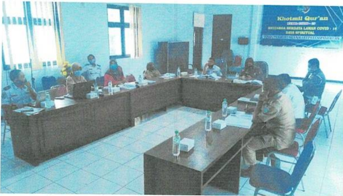
FOTO KEGIATAN RAPAT POKJA FLLAJ BULAN OKTOBER 2020